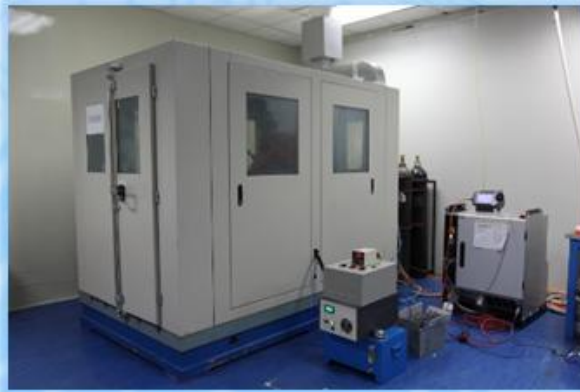
图 1 电弧等离子体加工装置